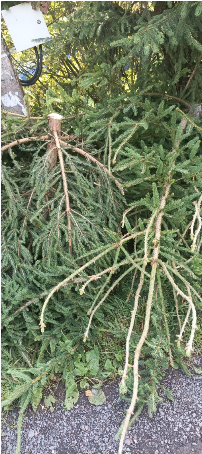
Выровняли ограждение у мусорных баков.